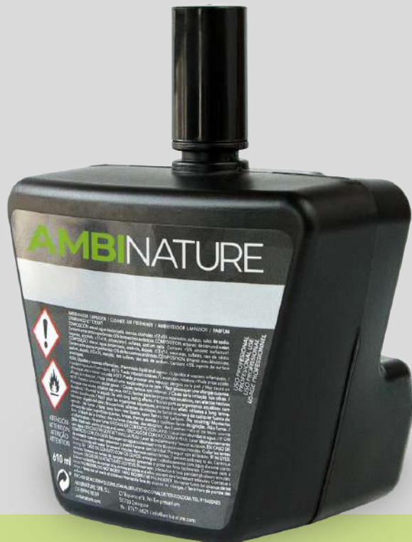
AMBICLEANER AMBINATURE 610ML