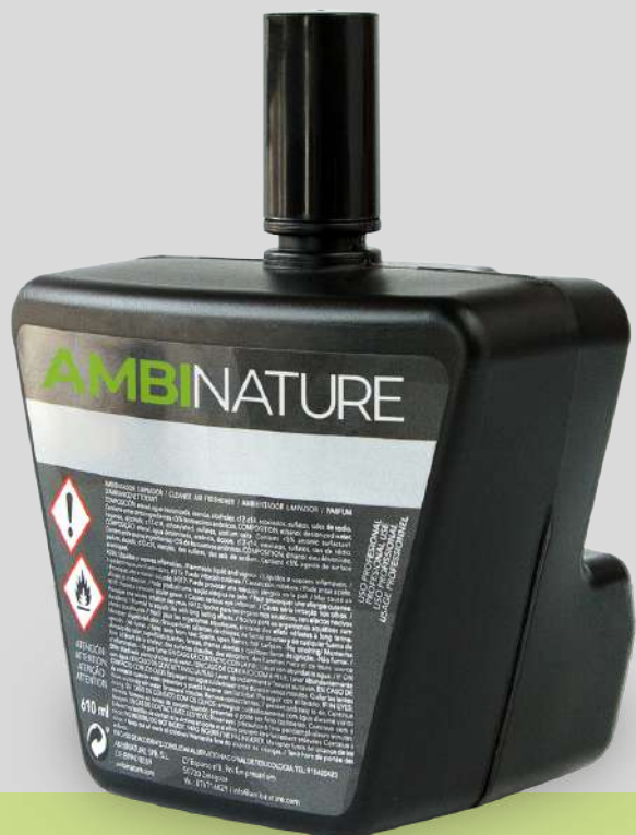
AMBICLEANER AMBINATURE 610ML