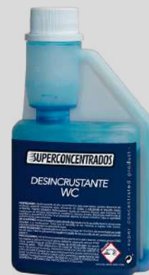
DESINCRUSTANTE PARA WC

LIMPEZA ECOLÓGICA E ECONÔMICA SEM SACRIFICAR QUALIDADE