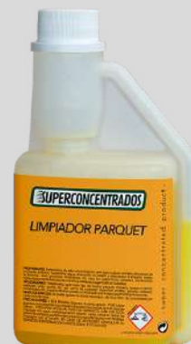
LIMPADOR DE CHÃO DE MADEIRA